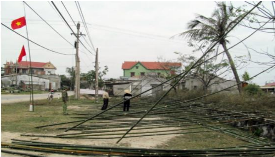
Người dân dựng cây nêu đón tết. Ảnh minh họa

LBO | 26/01/2021 | 14:17 Thích Chia sẻ 99 người thích nội dung này. Hãy là người đầu tiên trong số bạn bè của bạn.